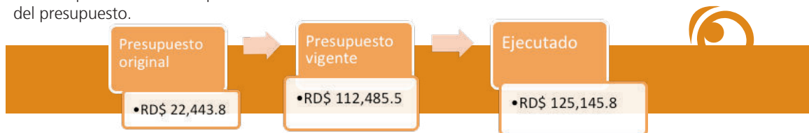
Ilustración 1. Déficit del Gobierno central año 2012 (en millones de pesos)

Este aumento desmesurado de las fuentes financieras también implicó un mayor nivel de déficit. Una de las formas de calcular el déficit (o superávit) es obteniendo la diferencia entre las fuentes financieras y las aplicaciones financieras (pago de deuda). En el año 2012, el Gobierno ejecutó RD$ 62,628.80 millones en aplicaciones financieras. Si calculamos la diferencia entre los préstamos incurridos y el pago de deudas, tenemos un resultado deficitario que asciende a RD$ 125,145.80 millones. Este nivel de déficit, según la Cámara de Cuentas, representó una desviación de un 11% respecto al déficit aprobado en la modificación del presupuesto.